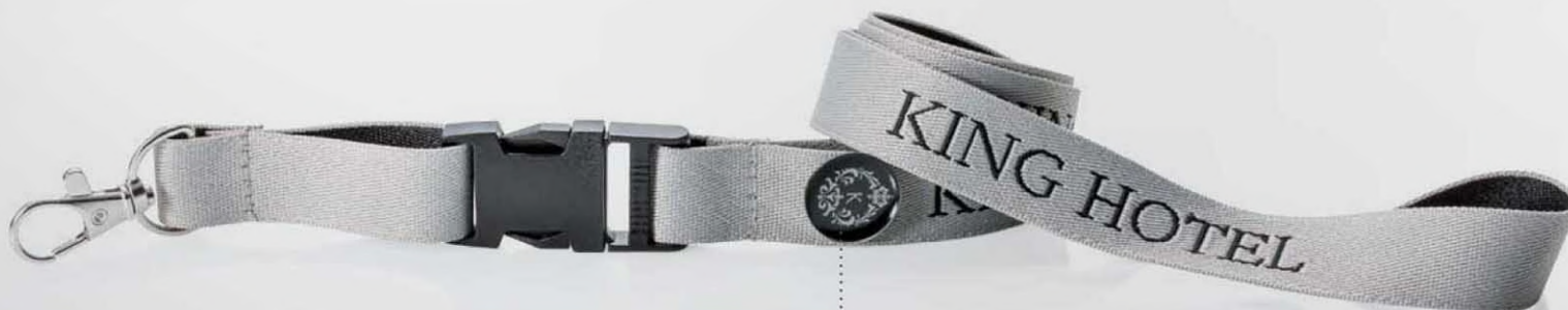
Rückseite - Stickpin mit Butterfly-Verschluss